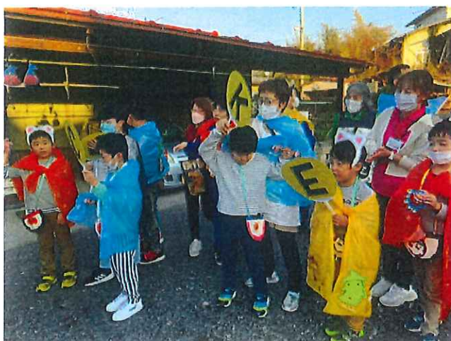
<ハロウィンパレード>