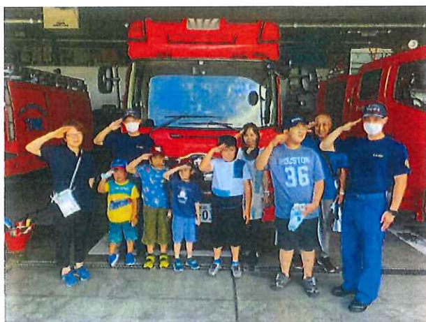
<消防防災センター見学>