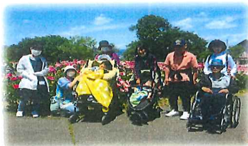
〈シャクヤクまつり見学〉