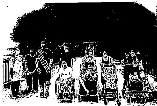
サンオーレ袖浜に行こう